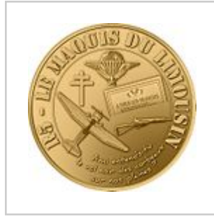
Visuel de la médaille souvenir « R5 - Le Maquis du Limousin ».